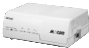
フレックスホン、ボイスワープなどにも対応

問い合わせ 古河電気工業(株)営業本部電子機器営業部 TEL 03-3286-3116