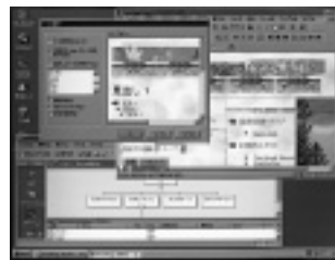
ウィンドウズ95/NT 4.0Workstation対応

問い合わせ マイクロソフト(株)インフォメーションセンター TEL 03-5454-2300 URL http://www.microsoft.com/japan/office/frontpage/