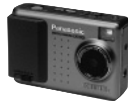
ストラップは首からかけられるタイプが付属

問い合わせ パナソニックカスタマーサポートセンター TEL 03-3834-2921