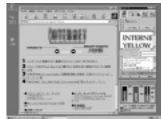
キャッシュコンピュータソフトも付属

問い合わせ デジタルアーツ(株)ユーザーサポートセンター TEL 03-5485-1334