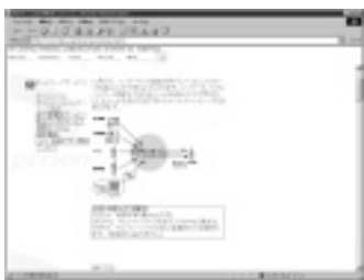
ホームページにはPHSに関する最新情報が

問い合わせ NTTパーソナル中央 TEL 0120-898956 URL http://www.nttphs.co.jp/