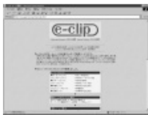
新聞やスポーツなど42サイトの情報をクリッピング