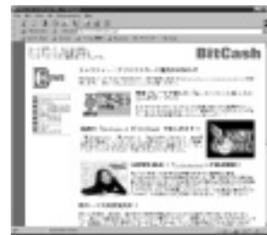
6月から実用化されている電子マネー、ビットキャッシュのホームページ。 URL http://www.BitCash.co.jp/

コンテンツといえば、ストリーミングコンテンツ、特に音楽データの配信が実用域に達してきたことも今年のニュースだ。リアルネットワークス社のリアルプレイヤー、マイクロソフトのネットショーの登場により、28.8Kbpsのアナログ回線でステレオクオリ