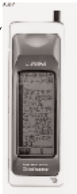
全面液晶タッチパネルを搭載した「DP-211SW」