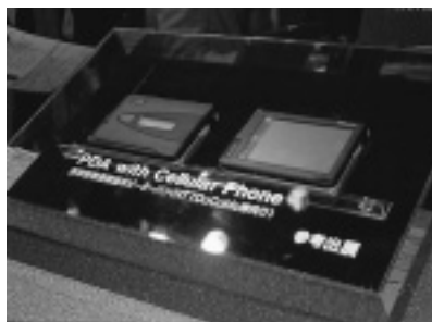
松下電器産業ブースで参考出展されたNTT DoCoMo向け「ピーターパン」

しかし、今年の一番の特徴は、PHS内蔵型PDAが数多く出展されていたことだ。三菱電機が参考出展していた「ワイヤレス