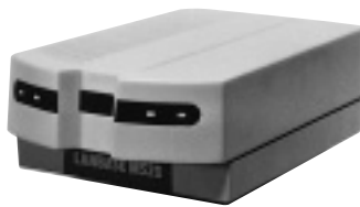
電話回線1回線収容タイプで118,000円より

問い合わせ 日新電機株 TEL 03-5821-5914 URL http://www.nissin.co.jp/