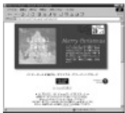
上記ホームページからカードの送信ができる

問い合わせ Global Card Project事務局 TEL 03-5421-1901 URL http://g-card.ntt-ad.co.jp/