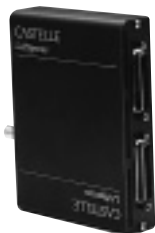
ネットワークの規模に合ったパラレル数が選択できる

問い合わせ (株)マクニカ ネットワーク事業部 TEL 045-939-6155