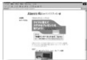
ホームページでクイズをチェックして申し込もう!