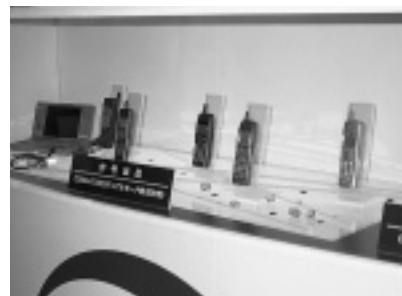
W-CDMA方式の携帯電話が展示されていたDDIセルラーのブース

小型の通信機器やノート型パソコンなど、モバイルを強く意識した商品が多かったのが印象深いCOM JAPAN '97だった。