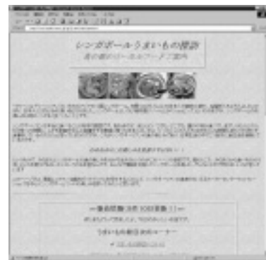
ページの保存を求める多くの声に応え、日本でも公開！

URL http://www.asahi-net.or.jp/~pp7j-tzk/welcome.html