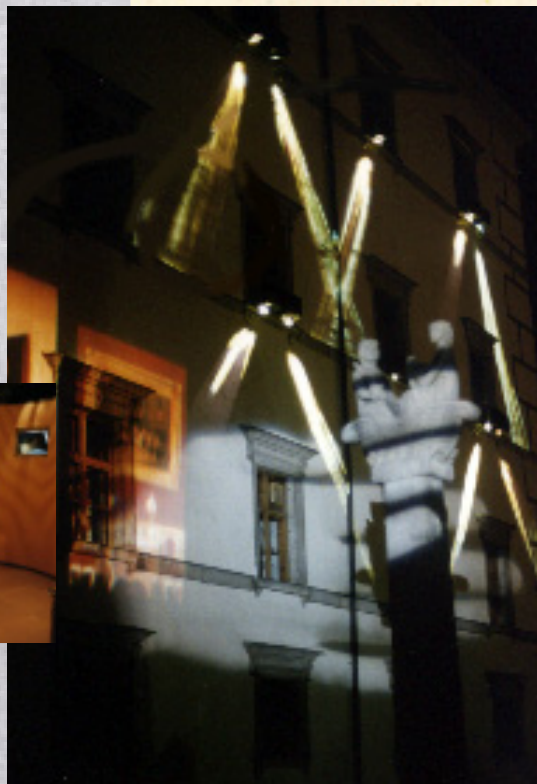
ラファエル・ロサノ＝ヘンメルの「ディスプレイスト・エンペラース」(AEC)。