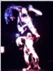
ステラークのパフォーマンス「パラサイト」。

注1) アルスエレクトロニカセンター (http://www.aec.at/) : オーストリアのリンツにあるメディアアート専門の美術館。毎年ここを中心会場としてアルスエレクトロニカフェスティバルが行われる。