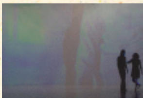
日本から参加したアートユニット、ダムタイプの作品「OR」。