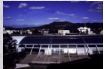
メイン会場となったアルスエレクトロニカセンター(上)とデザインセンター。