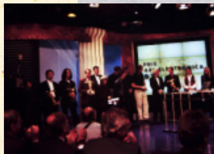
オーストリア国営放送スタジオ内での授賞式風景。ORFはフェスティバルの主催者でもある。