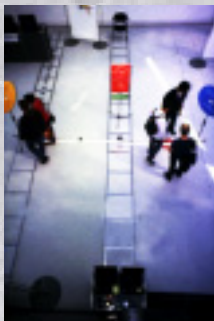
「センソリウム」スタッフによるインスタレーション。好評だったウェブホッパー(上)とネットサウンド(下)。