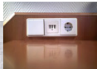
ラマダ・ホテルの部屋にあったモジュラージャック。国ごとに形が違うからめんどろだ。

センソリウムの竹村真一プロデューサーが「我々は新しいページをつくったのではない。ネットワークが生きていることを示すために、既存のリソースや技術を組み合わせ、インターネット自体をコンテンツ化したのだ」と、なかなかいいスピーチをする。