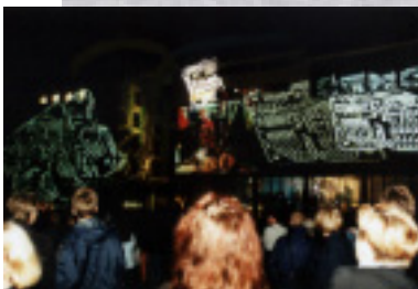
オープニングイベント「ボディビルダー」。サウンドに合わせてアルスエレクトロニカセンターの外壁に映像が投影された。