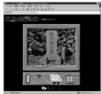
ショックウェーブでお墓参りもできる！