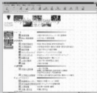
上智大学のホームページ。同大学の力の入れようがうかがえる充実したコンテンツだ。

上智大学では10月までに端末室3室を増設し、コンピュータも280台に増やすという。