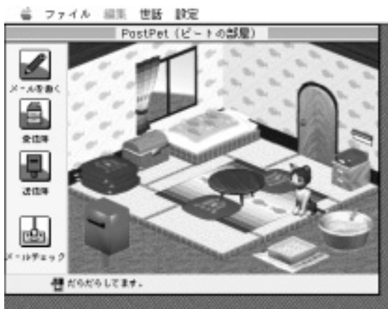
① この部屋でポストペットとの生活が始まる。自分の宛のメールを届けに、ほかのペットもやって来る

ベータ版のころから注目されていた愛玩メールソフト「PostPet」の正式版がついに登場した。メールソフトといっても、近頃の機能満載型のメールソフトとはまったく違う。育て系ゲームの要素も盛り込んだコミュニケーションツールなのだ。正式版ではペットにメールを届けてもらうと発生するさまざまなイベントも盛り込まれている。さっそく、手塩にかけて育てた可愛いペットに大事なメールを届けてもらおう。