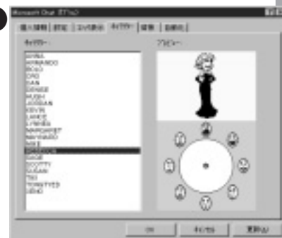
① 男性、女性、原始人、宇宙人など、姿形もさまざま