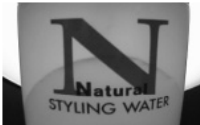
撮影: Cyber-shot DSC-F2 (ソニー)

毎朝使っている男性用化粧品ですが、これってどこかのブラウザのマークみたいなんです。(飯沼実)