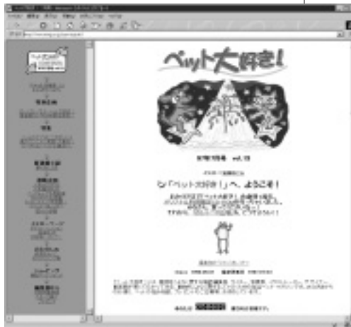
◎スタッフの動物に対する愛情が伝わってくる「ペット大好き！」。「ペットなんでも相談室」は人気コーナーの1つ。 URL http://www.mmjp.or.jp/pet-daisuki/

岡見：紙の雑誌は、造本費・編集費で、数千万円はかかります。でも、ホームページは、コンテンツを作るのにはお金がかかりますが、それ以外はサーバーの維持管理費だけ。月に数千円の世界ですから。でも、当初は、もっと簡単にタイアップ広告が決まると考えていたんですが、そんなに甘くはなかったですね。「ペット大好き！」のアクセス件数は月に6,000～1万件くらいなんで、大企業の1日何万件というのに比べたら大したことはない。そうすると、大手企業はメディアとしてあまり大きな影響力があるとは思ってこないし、実際大きなメディアじゃないんです。媒体価値とし