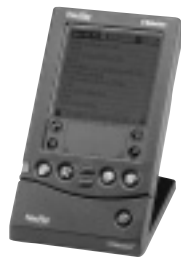
単4型電池2本で動作し、日本語マニュアルが付属