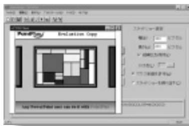
デモ版はホームページからダウンロードできる