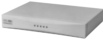
端末型ダイヤルアップ契約で複数台を接続できる NAT機能も搭載