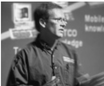
米国マイクロソフト本社で行われた「ウィンドウズTCOサミット」の様相

6月26日に米国マイクロソフト本社で行われたTCOサミットでは、新しい技術として「ローカルキャッシング」のデモが行われた。サーバーにあるファイルやアプリケーションをローカルのハードディスクにキャッシュしておくことで、サーバーの停止やネットワークの切断といった事故に対処するというものだ。この技術が発表された背景には、将来のライバル「NC」の存在がありそうだ。以前から、「NCはネットワークが切断したらただの箱」という欠点が指摘されていたが、ローカルキャッシングはこれに対するマイクロソフト社の回答とも取れる。同じ意味で気になるのが、ウィンドウズファミリーのメンバーである「ウィンドウズターミナル」の存在だ。ウィンドウズターミナルでは、Citrix社の「Win Frame」という技術を採用して、HydraサーバーにあるアプリケーションをHydraクライアント上で動作させる。ここにもNCの影が見え隠れしている。 マイクロソフト社によれば、ウィンドウズNTサーバーとNetPCで構築した環境をゼロアドミニストレーションによって管理すれば、TCOは現在の54パーセントに削減されるということだ。これがどこまで現実のものとなるか、今後注目したい。