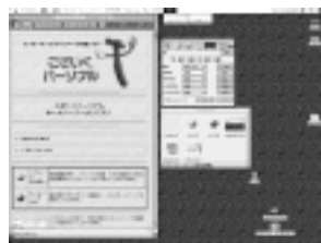
「こざいく パーソナルver3.0」の作成画面