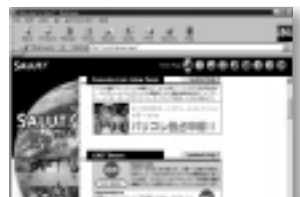
日々最新情報に更新されるウェブマガジン「Salut!」