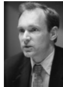
初来日を果たしたW3C技術総括責任者 ティム・バーナーズ・リー氏

ープンスタンダードなものなのでこうした対立を招くのかもかもしれないが、逆に有用なものが一般の人に受け入れられていくのだと思う。W3Cとしては、その選択肢を一般に提示するという役割を担っていると考えている」と答えた。