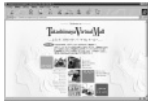
「タカシマヤ・バーチャルモール」のホームページ