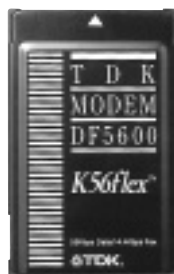
K56flex準拠のカード型FAXモデム「DF5600」

問い合わせ TDK(株)システムズ事業部PCカードサポートセンター TEL 047-378-9406