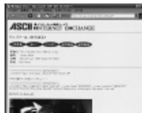
WWWブラウザ上でメールの確認ができる