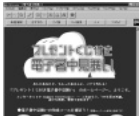
ホームページ上でカードを作成する