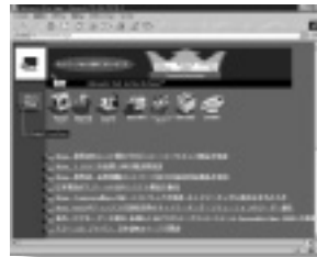
スリーコム ジャパンのホームページ