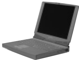
バッテリーで6時間駆動できる「PCG-707」

URL http://www.sony.co.jp/ProductsPark/Consumer/PCOM/index.html