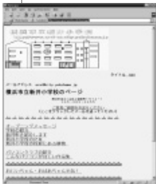
● 新井小学校のホームページ URL http://www.arai-es.city.yokohama.jp/