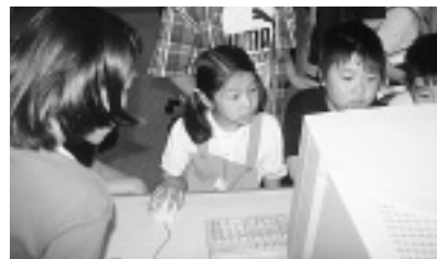
● 慣れない手つきでマウスを操る。

「いろんなことが書いてあっておもしろいよ。慣れたら簡単になったよ。探すのが難しい」