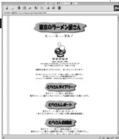
◎ 完食したお店には「完食マーク」が与えられる「東京のラーメン屋さん」のレポートはけっこう辛口? URL http://www.hiryu.co.jp/ramen/index.html

大崎: もうすぐ私も40歳ですし、高血圧気味で医者にはラーメン食べるのを止めるようにも言われているので、700杯も食べるのは今年が来年までにして、そうすると