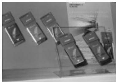
モバイルも新アイテム、三菱電機のPHS無線カード