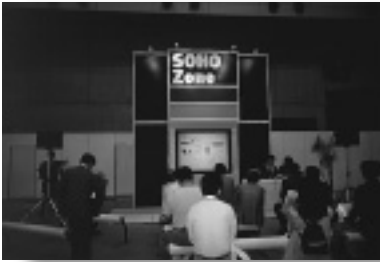
人気を集めたSOHOゾーンのステージ

演は、「N+1ならでは」という新情報はなく、それぞれが自社のソフトウェア製品や技術の優位性を語るという最近のお決まりのパターンだった。