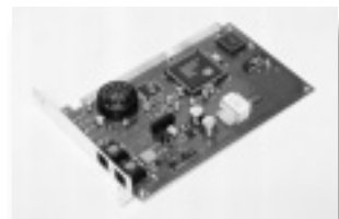
K56Flex準拠の「ModemSURFR 56K ISA」

問い合わせ 日本モトローラ㈱情報システム事業部営業部 TEL03-5487-8540 URL http://www.mot.co.jp/html/products/ms.html