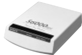
USロバティクス社が提唱する規格「x2」を採用