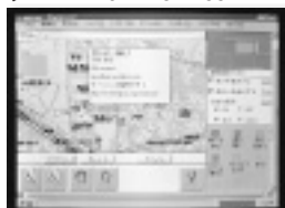
アイコンをクリックすると詳細情報を表示する

問い合わせ ㈱富士通ネットメディア研究センター TEL 044-754-2667