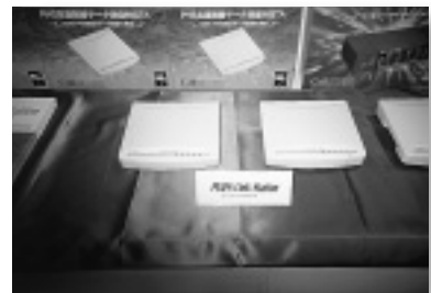
人気のPIAFS用PHSに対応したコーラスコンピュータのTA。新型TAはほとんどがPIAFS対応となっていた

今回のN+1では、地味ながら大小さまざまなブースでセキュリティと認証システムを展示していたのだが、世界各国の金融機関、カード会社が運用実験に入りつつあり、実用化、時期が期待されているEC（エレクトロニックコマース）関連の大規模な実験や展示が行われていなかったのが残念でならない。しかし、ご存じのようにコンピュータの世界、とりわけインターネットの世界の進歩は速い。来年のN+1では、実用的なセキュリティ、認証技術とソフトウェアを基礎としたECの実験、ではなく現実のモールなどのデモンストレーションが展示されることを期待したい。