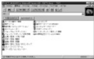
「NIFTY MANAGER for Windows95 Version 4.00」

ニフティは6月18日より、インターネット経由で「ニフティサーブ」への接続サポートを開始する。「ニフティマネジャー」の新バージョンによって、社内LANやイントラネットからでもインターネット経由でニフティサーブに接続できるようになり、プロバイダーに接続した状態からでもニフティサーブを利用できる。また、MIMEエンコードにも対応し、テキスト以外のバイナリデータを簡単に電子メールに添付することもできるようになった。