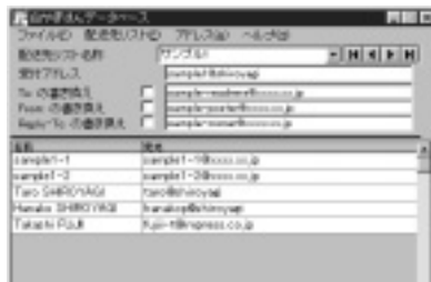
送信先の設定画面