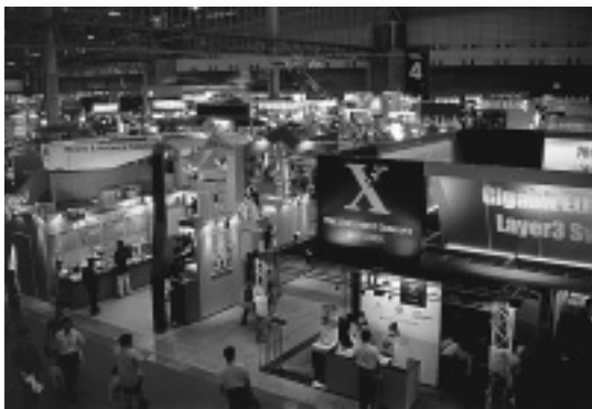
3日間で9万人もの来場者を集めたN+1'97

サン・マイクロシステムズ社主席科学者のジョン・ゲイジ氏の基調講演、マイクロソフト社副社長のリチャード・タン氏の基調講