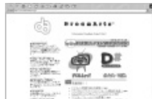
ドリーム・アーツのホームページ