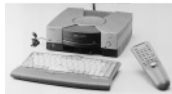
DVD-ROMドライブで映画なども楽しめる