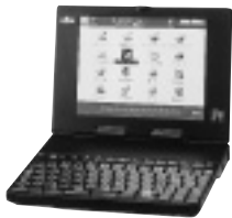
ディスプレイが360度反転する「インタートップ」

問い合わせ 富士通(FM)インフォメーションズ TEL 0120-89-4321