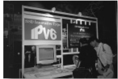
最先端技術のひとつであるIPv6の実験展示が間近に見られる

ハブ、低出力のPHSを用いた簡易型無線LANなどの商品がそれだ。これは、近い将来、アメリカのように大きな市場として成長する前兆なのだろうか。