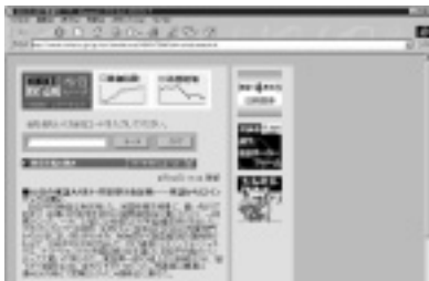
会社名、株価コードで株価を検索できる