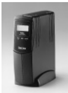
電話機からアナログポートの設定ができる

NECは6月23日から、ターミナルアダプターのAtermIT65ProとAtermIT65Pro DSUを発売する。新製品は液晶パネルを装備し、通信状態や設定内容、発信者番号などの確認ができる。また、電話機からアナログポートの設定ができ、USBポートも搭載した。さらに、停電時にはニッカド充電電池が使えるようになった。価格はIT