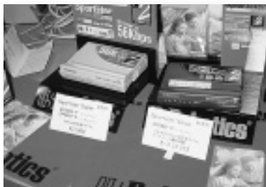
規格統一が持たれるUSロボティクスの56Kモデム

そんななか、そろそろSOHO（スモールオフィス・ホームオフィス）向け商品が現れ、来場者の注目を集めていた。NTT-TEのMN128-SOHOや富士通のNetViecleなどのダイヤルアップルーターや小型で低価格の