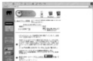
名前以外の登録項目は非表示にすることもできる