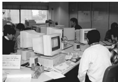
▲「かながわマルチメディアサロン」を使った授業。

同校には、マルチメディア産業を育成するために神奈川県と地元企業が開設する「かながわマルチメディアサロン」もあり、専用線で接続されたコンピュータを広く一般に開放している。