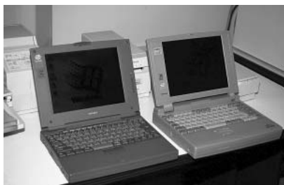
▲入学時に1人1台無償貸与されるノートパソコン。

最近、インターネットを授業のカリキュラムに取り入れる専門学校も増えてきた。今回はそうした専門学校の中でもインターネットをはじめとしたマルチメディア教育に積極的に取り組む、学校法人岩崎学園情報科学専門学校(横浜西口校)の門をくぐり、インターネット教育の授業を見せてもらった。