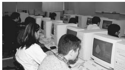
▲コミュニケーションシステム科2年生のホームページ作成実習。

「将来は公務員になりたい」、「まだコンピュータが導入されていない分野でコンピュータを役立てたい」など、インターネット業界にこだわらず、コンピュータやネットワークの可能性を幅広い分野で役立てたいと、なかなか積極的だ。