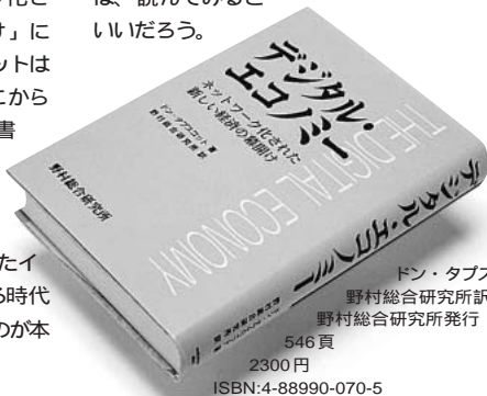
ドン・タプスコット著 野村総合研究所訳 野村総合研究所発行 546頁 2300円 ISBN:4-88990-070-5

書である。デジタル・エコノミーのもとで、それぞれのビジネスがどんな意味を持つのかを答えている。インターネットを代表とするこれからの情報基盤を通して変わっていく経済を探る本としては、とてもよくできているだろう。現在、インターネットで行われている状況であるものの、「ピーニングデジタル」ほど将来の予測が書かれていない、それだけ経済は見通しが難しいのだろう。リストラの次の策がたたなければ、読んでみるといいだろう。