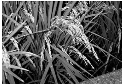
たわわに実ったこらべを垂れる稲穂。あとは稲刈りを待つばかり。

先月は、神戸新聞や一般トレンド誌『日経トレンド』に掲載されました。いまままで経済誌やインターネット専門誌が多かったのですが、なんてたって全国的「トレンド」としてわがバーチャル田んぼが仲間に入れて頂けたのですから、みんなで泥の中、麦わら帽子に地下足袋を履いて田植えしたのも報