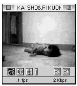
⑦ 疲れて寝ちゃったのかな？お疲れ様でした。ゆっくり布団で寝かせてあげてくださいね。