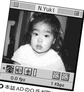
⑨ 本誌ADのO氏が気に入っている有希ちゃん。