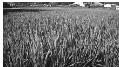
稲が育つ龍野市の田んぼ。左から3番目が「満作」(といっても読者にはきっとわからないだろう)

少し大きくなると稲との見分けがつきにくくなりますが、放っておくと稲の栄養を取り込んで稲の成育を妨げることになります。そこで、近