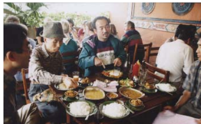
カトマンズのレストランでダルバートを賞味