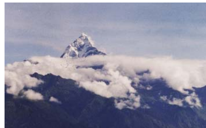
ネパールを象徴するヒマラヤの山並み

外へ持っていくときにはあらかじめ準備しておくべきだった。もっとも今回のようなあわただしさでは気付いていたとしても結局そんな余裕はなかっただろう。