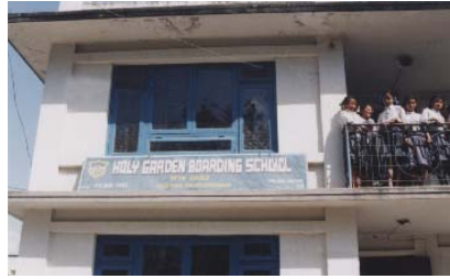
今回インターネットに接続されたホーリーガーデンハイスクール