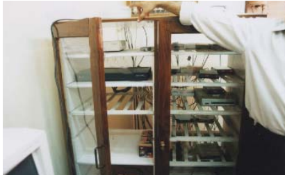
プロバイダーのルーターとモデム