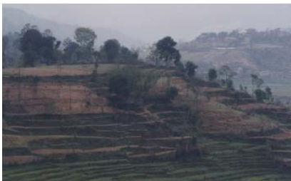
山の斜面に広がる耕地