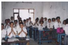
「ナマステ」とあいさつしてくれた生徒たち

やっと順番が回ってきた。係官はフィニッシュ、フィニッシュと連発する。お前のパスポートの処理を終わったから金をよこせという意味らしい。知らないふりをしていと恨めしそうな、哀しい目で訴えてくる。たしかにこの職員とて月給が5000円程度だろう。観光客がどんどん増え、馬鹿なエ・ジェントが札たば教育をしていくのだ。それが、謙虚で自然とともに生きるネパールの国をどんどん正直者が馬鹿を見る国に変えていくことだろう。