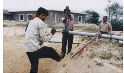
ドリケル病院の建設現場