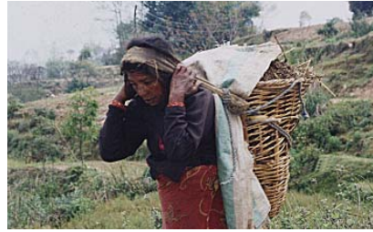
重い荷物の運搬もほとんど人力が頼り