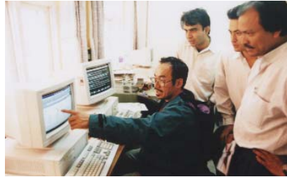
プロバイダーのMercantile Communicationsにて