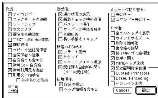
●図5 マッキントッシュのEudoraではここを設定すると、宛先によっては図2のような配達証明が返ってくる。