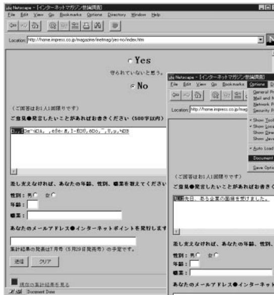
◎図1 ネットスケープ2.0で文字化けしている様子

の文字を統一して表すコードセット がWindowsNTなどに採用されてい ますが、これでも根本的な解決に ならないのです。UNIX用のmuleや mterm(xtermの国際化版)の作り 方を参考にして、日本からライ ブラリをきちんと出すなど、より よいソフトウェアが流通するように 我々が努力しないとならないと思 います。