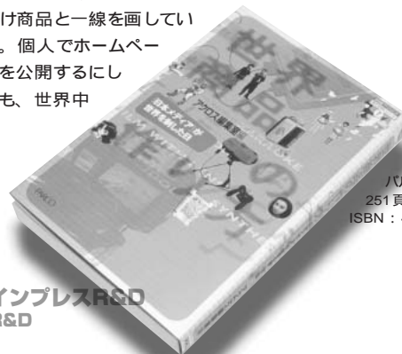
アクロス編集室編 バベルコ出版発行 251頁 1600円 ISBN : 4-89194-451-X