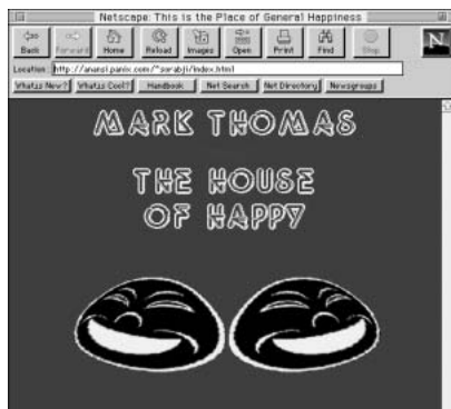
This is the Place of General Happiness